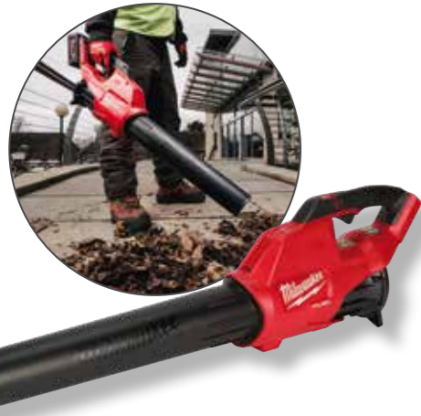
Milwaukee Akku-Gebläse M18FBL-0 A0032447