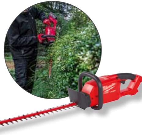
Milwaukee Akku-Heckenschere 60 M18CHT-0 A0030781

137,- € Aktionspreis:* 137,- € exkl. gesetz. MwSt.