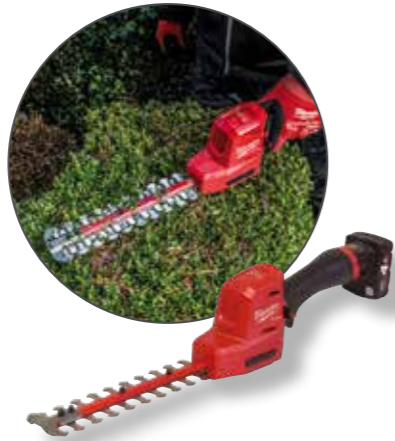
Milwaukee Akku-Heckenschere 20 M12FHT20-0 A0058960

127,02 € Aktionspreis:* 161,- € exkl. gesetz. MwSt.