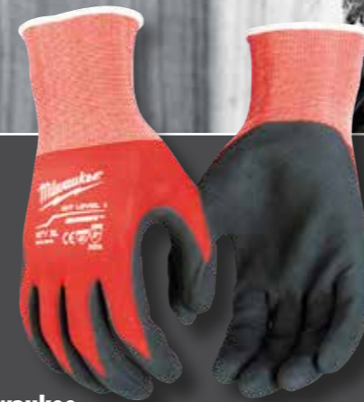
Milwaukee Schnittschutzhandschuh Klasse 1