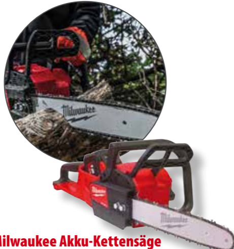
Milwaukee Akku-Kettensäge M18FCHS35-122 A0058955

419,00 € Aktionspreis:* 404,- € exkl. gesetz. MwSt.