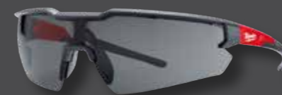
Milwaukee Schutzbrille getönt SLIM

4,40 € Aktionspreis:* 2,40 € exkl. gesetz. MwSt. Preis per Paar Mindstabnahme ein VE = 6 Paar