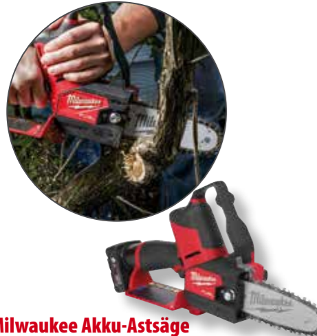
Milwaukee Akku-Astsäge M12FHS-602X A0058954

269,69 € Aktionspreis:* 249,- € exkl. gesetz. MwSt.